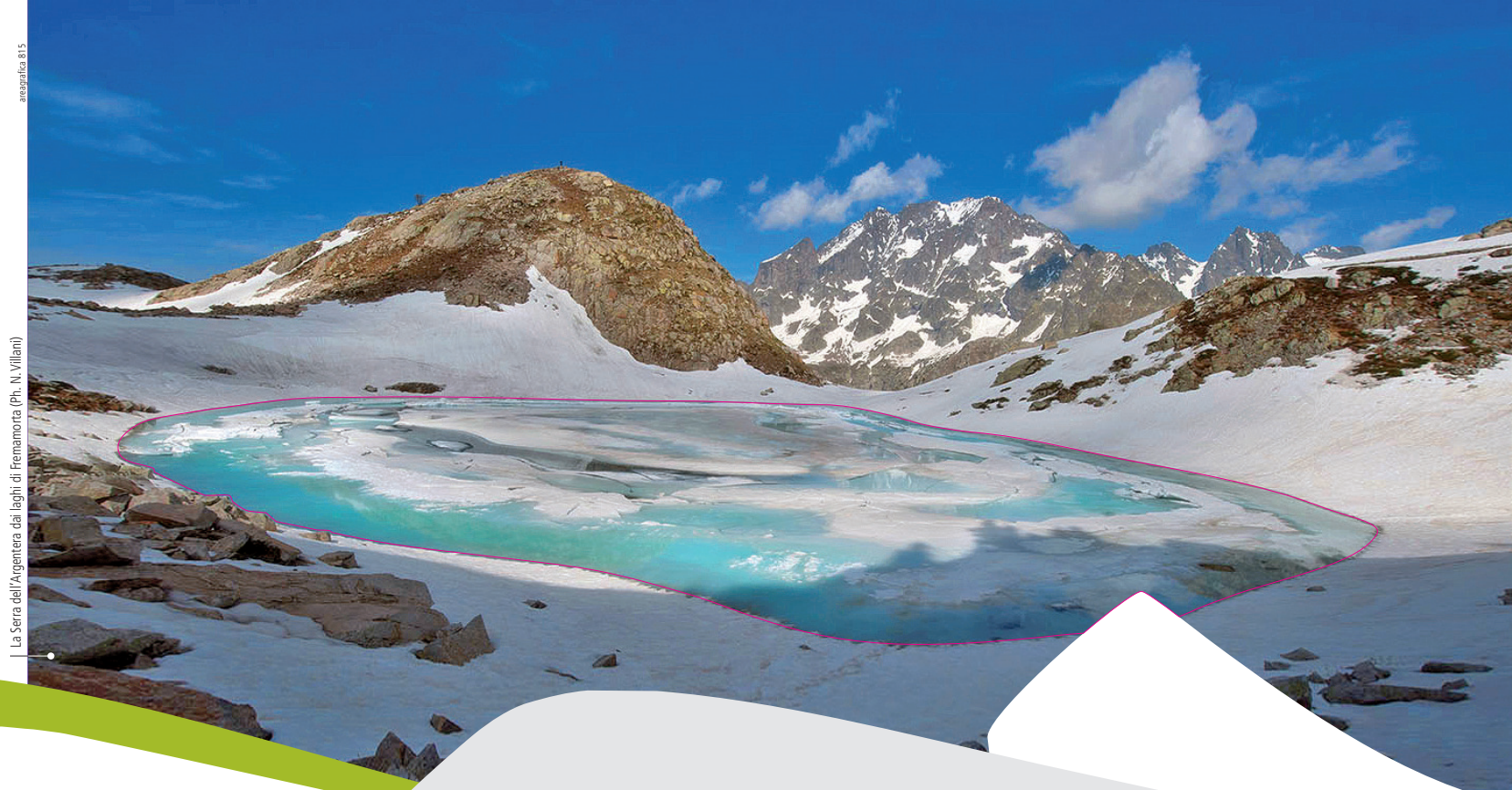
La Sere dell'Argentera dai laghi di Frenamonta