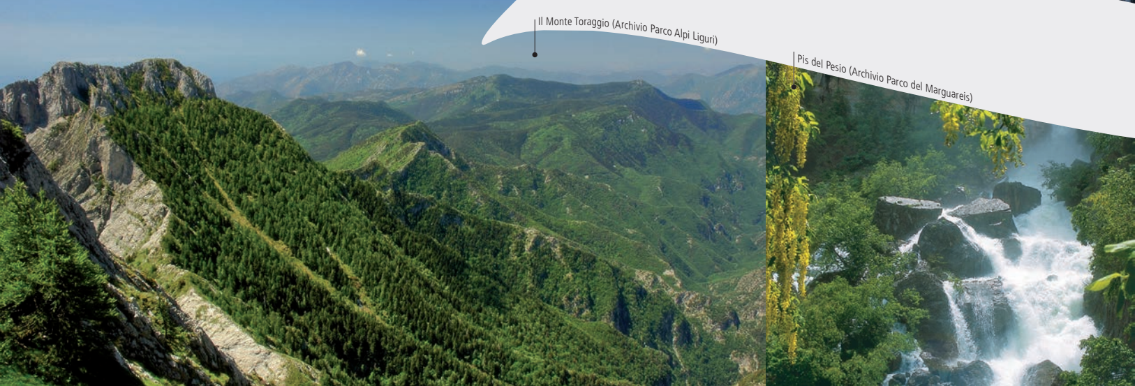
Il Monte Toraggio